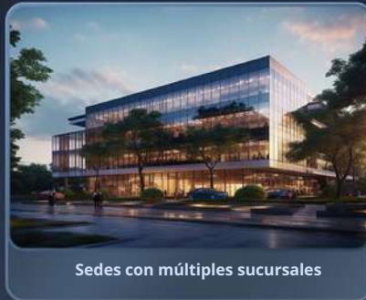
Sedes con múltiples sucursales