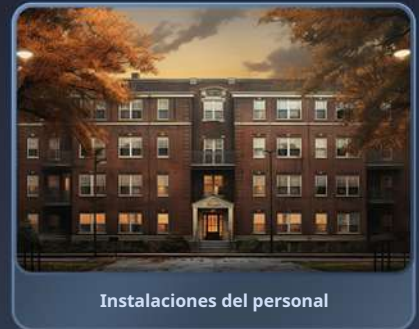
Instalaciones del personal